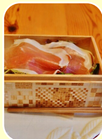
ソラアンナ (イタリアン)