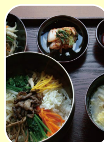
マダム・スン (韓国料理)