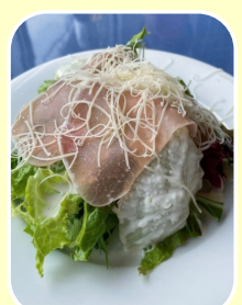
ラ・パツア (イタリアン)