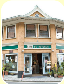
カフェ・モトナ (カフェ・ランチ)